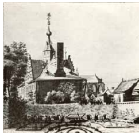
Schuttershof 'De Edele Voetboog'

is groot. De grootste brand in Goes vindt plaats in 1554. Een kwart van de – houten – huizen brandt af. Een enorm verlies voor de stad. Veel huizen zijn na de stadsbrand herbouwd in steen. In die periode heeft Goes ca. 1.750 inwoners.