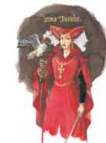
Jacoba van Beieren

hiermee is het proces van dorp tot stad voltooid. Gravin Jacoba van Beieren verleent de stad in 1417 het recht om muren en poorten te bouwen, waarmee Goes ook het uiterlijk krijgt van een stad.